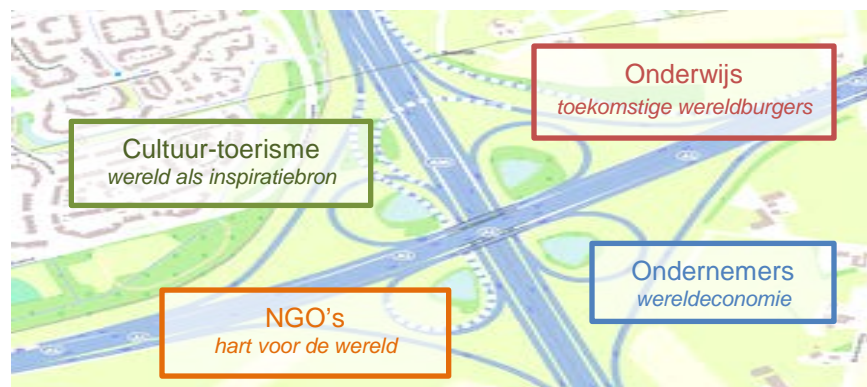
Klaverblad van sectoren die in verbinding staan voor een internationale groei in Deventer

Vanuit de historie in het Hanzeverbond (wel 300 jaar met 200 steden) zijn we een stad met ondernemersbloed, internationale kennis en ambitie en gewortelde waarden in de zorg, onderwijs en religie. Qua infrastructuur genieten we van een goede ligging tussen Noorwegen-Afrika en Engeland- Baltische Staten. Voor de globaliseringstrend is dit internationale DNA van Deventer een essentiële voorwaarde. 1 En dat zie je terug aan het grote aantal NGO's, dat internationaal actief is, de samenstelling van de stad 1 en de internationaal georiënteerde bedrijven. Het huidige economische, internationale en Europese beleid van de gemeente vormt een gezonde basis, die op veel draagvlak in de samenleving berust. We willen die kracht nu verbreden. De meerwaarde zien wij, gevoed door de internationale partners in Deventer, in de synergie en verbinding tussen de verschillende sectoren en met Europa.