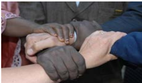
Hand in hand voor een betere wereld

De afgelopen jaren heeft de gemeente Deventer bewust gekozen een aantal internationale projecten ter versterking van het lokaal bestuur in de partnerlanden uit te voeren. Via programma's van VNG International en/of het Ministerie van Buitenlandse Zaken, werken we alleen in landen waar mensenrechten zijn gewaarborgd en is de financiering van een project gedekt. We hanteren een projectmatige aanpak (geen officiële jumelages) en werken samen met andere gemeenten en partners in Nederland en buitenland. Deze projecten leveren voor lokale organisaties synergievoordelen op. Momenteel vooral in EU toetredingsland Turkije en in het ontwikkelingsland Uganda, waar veel Deventer organisaties actief zijn en waar succesvolle synergie tussen verschillende sectoren is ontstaan (overheid, maatschappelijk middenveld, onderwijs en het bedrijfsleven). Deze gemeentelijke internationale inzet wordt gecontinueerd. De uitgangspunten voor internationalisering en duidelijke aanpak, zoals beschreven in de evaluatie van Deventer Internationaal 2009 – 2014 , blijven de komende jaren van kracht.